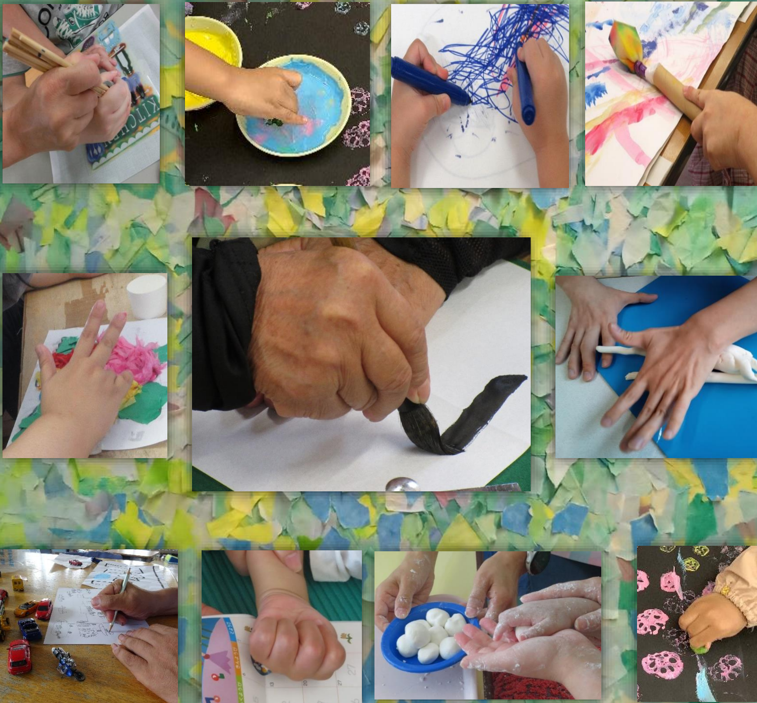
背景は槻の木の商品です😊