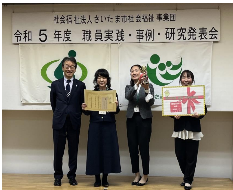
授与式で笑顔のはるの園の皆さんと理事長