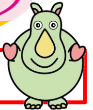
さいのたまちゃん