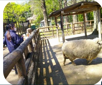
色々な動物とのふれあい