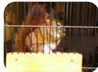
無料で楽しめる動物園です