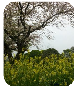
桜がとても綺麗でしたね