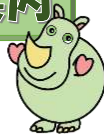
様式第1号(第2条関係)