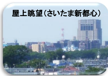
屋上眺望(さいたま新都心)