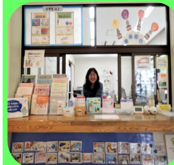
申請書の受付をします