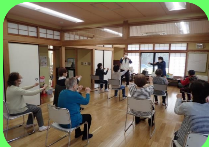
運動教室の様子。楽しく運動しています♪