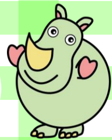
サイのタマちゃん