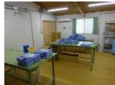
さぎょうしつ 作業室2