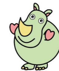
サイのタマちゃん