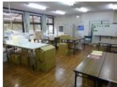
さぎょうしつ 作業室1